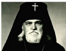
Архиепископ Ермоген, 1968

– В конце 70-х мне довелось служить в армии в Туркестанском военном округе, в Ташкенте и я ходил на службу в собор, построенный архиепископом Ермогеном (Голубевым), который вас рукополагал.